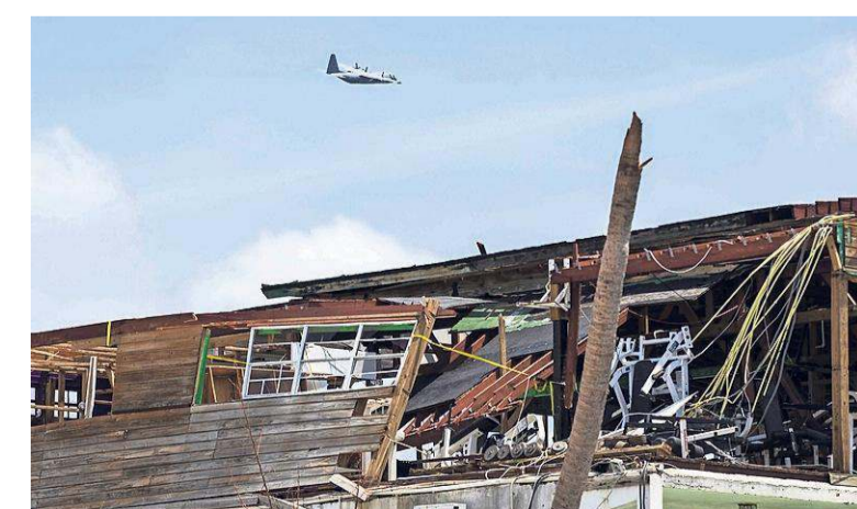
Een deel van de mensen kwam met een militair vliegtuig.