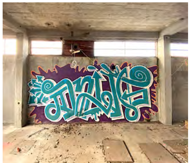
Verrassende graffitiwerken in het Silogebouw