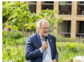
Opening De Meelfabriek Tuin - Commissaris van de Koning Jaap Smit