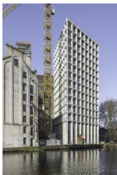
2025 Silotoren 250306 SAA - MF P36 - 0043 - 5K