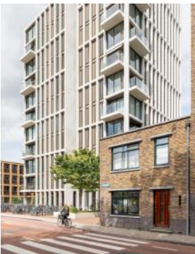
2025 Oosterkerkstraat 250820 SAA - MF P37 - 0112 - 5K