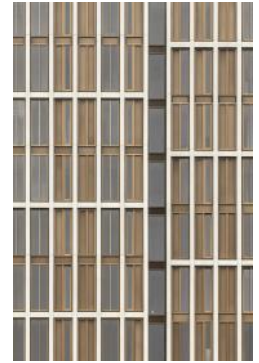
2022 Singeltoren gevel close