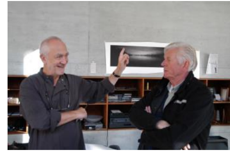
1947 (ca) zakkenvullers in Meelpakhuis, De Meelfabriek