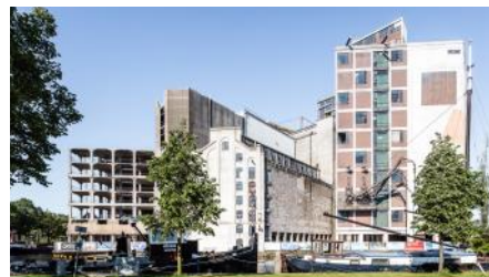
2020 De Meelfabriek - Zijlsingel _DS_006 PAN - X - 1600x2400