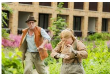
Opening De Meelfabriek Tuin - optreden Theater Domino