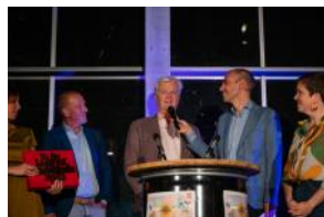
2023 RAP award, 111023-LR-70