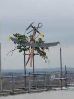
2023 hoogste punt Meelpakhuis