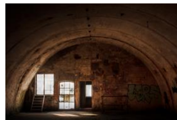
2018 Ketelhuis 180817__P6A2417 2000x3000