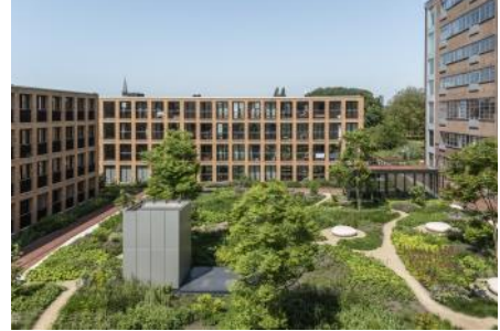
2024 De Meelfabriek Tuin - 240607 SAA - MF P35 - DRONE 0141 - 5000