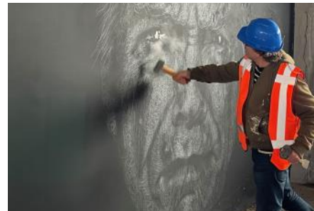
2021 start sloop Braspenning