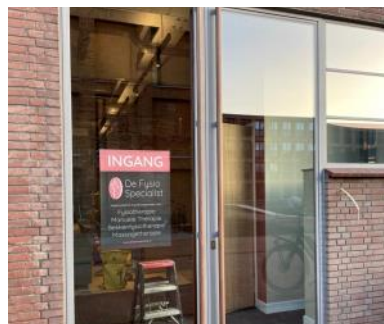
2022 De Fysiospecialist eerste huurder in Molengebouw