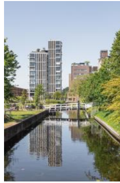
2023 De Meelfabriek Singeltoren vanuit Katoenpark - Corentin Haubruge