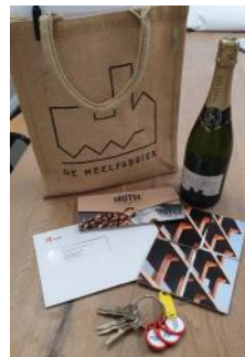
2024 oplevering Meelpakhuis lofts