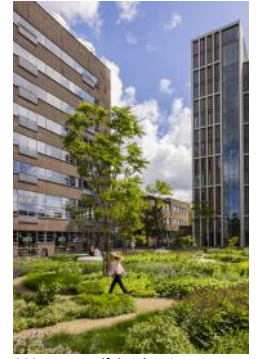
2024 De Meelfabriek Tuin, Riffellokaal, Singeltoren (GDandP)