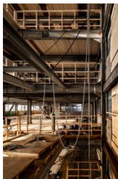
2018 Molengebouw-Riffellokaal 180817__P6A2518 2000x3000