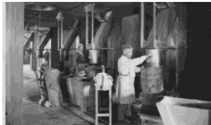
1900 (ca) De Meelfabriek - Zijlsingel