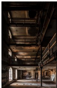
2018 Ketelhuis 180817__P6A2390 2000x3000