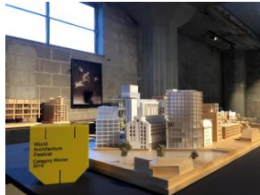
2019 WAF AWARD