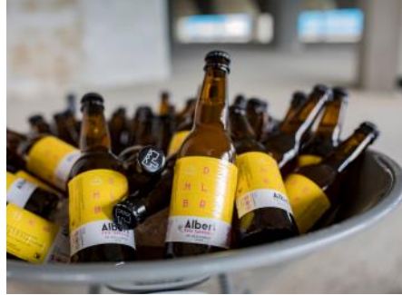
2023 lancering Albert Bier