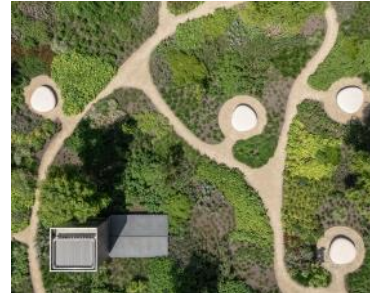
2024 De Meelfabriek Tuin - 240607 SAA - MF P35 - DRONE 0142 - 5000