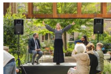
Opening De Meelfabriek Tuin - optreden Flamenco trio