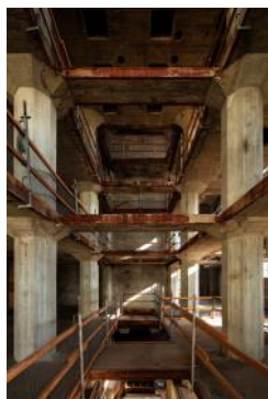
2018 Meelpakhuis 180817__P6A2438 2000x3000