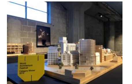
2019 WAF AWARD voor Studio Akkerhuis met De Meelfabriek