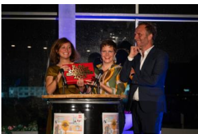
2023 RAP award, 111023-LR-67