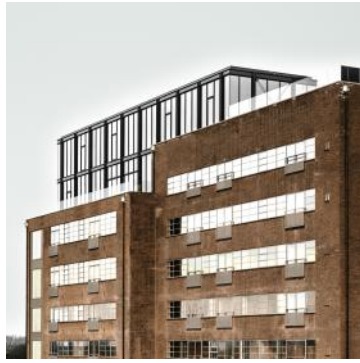
2023 De Meelfabriek Molengebouw en Riffellokaal - Corentin Haubruge