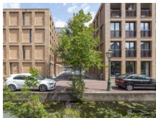
2022 DUWO studentencomplex De Meelfabriek 220715 SAA - MF P28 - R5.2 0113 - sRVB - 2500x5000