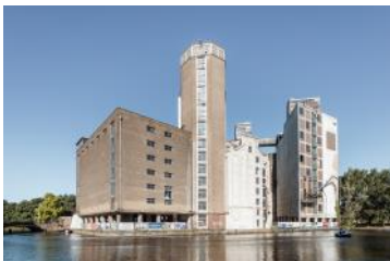
2020 De Meelfabriek aanzicht vanaf Zijlsingel - Corentin Haubruge