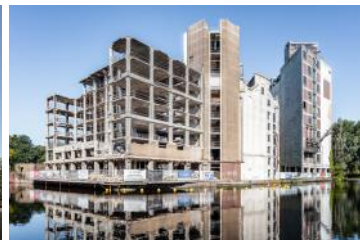
2021 De Meelfabriek aanzicht vanaf Zijlsingel - 210601MF P21 - 5DS_0014 - 2400