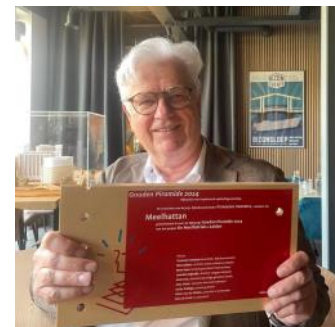
2024 nominatie Gouden Piramide