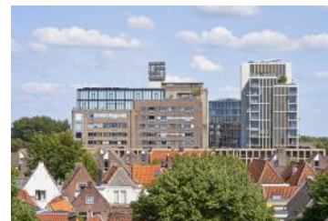
2023 Zicht op Molengebouw-Riffellokaal en Singeltoren vanuit centrumzijde