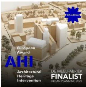
2023 De Meelfabriek AHI finalist