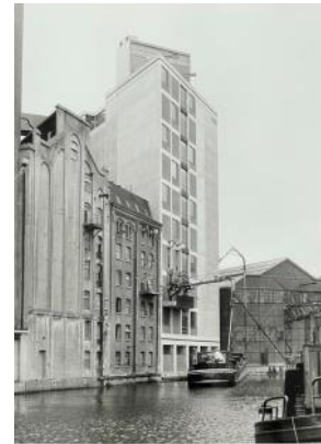
1902 - 4 juni brand De Meelfabriek