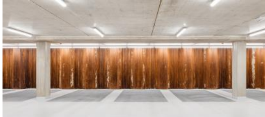
2021 De Meelfabriek Parkeergarage - Corentin Haubruge