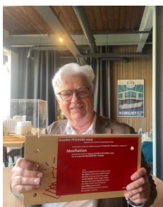
2024 nominatie Gouden Piramide