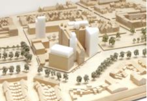
2023 De Meelfabriek Maquette Studio Akkerhuis Architecture