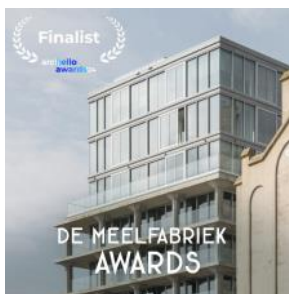
2024 Archello Housing of the year - mid rise