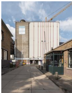
2025 Hotelgevel 250820 SAA - MF P37 - 0194 - 5K