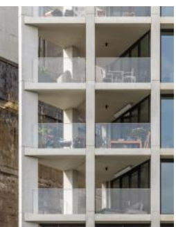
2025 Oplevering Silotoren 250820 SAA - MF P37 - 1242 - 5K