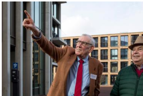
2024 oud medewerkers op bezoek