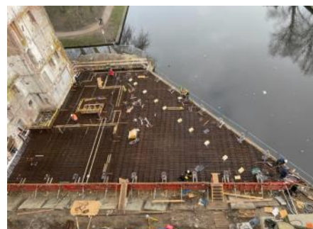
2023 Bouw Silotoren