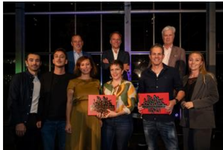
2023 Winnaar Rijnlandse Architectuur Prijs