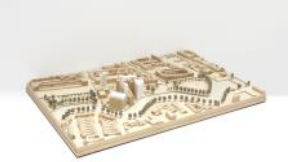
De Meelfabriek wood model view1 - Studio Akkerhuis Architecture