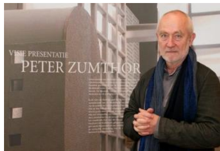
1939 - Bouw silo De Meelfabriek