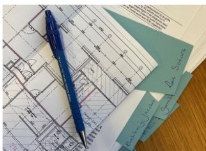
2023 contracten getekend huurders plint riffellokaal