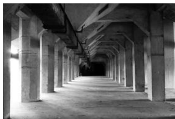
2016 De Meelfabriek Silogebouwen - Monica Stuurop