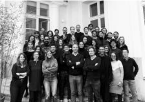
2020 Team Studio Akkerhuis Architecture