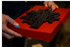
2023 RAP award, 111023-LR-79