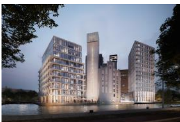
2024 Render De Meelfabriek vanaf Zijlsingel (Studio Akkerhuis Architecture)