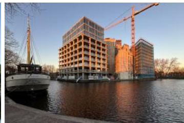
2024 De Meelfabriek aanzicht vanaf Zijlsingel - Corentin Haubruge