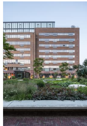
2024 De Meelfabriek Tuin - 240607 22h05 - SAA - MF P35 - R51 0872 - 3600