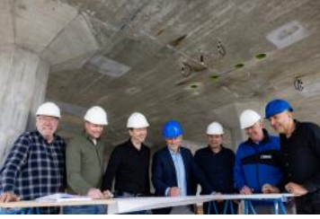
Van der Wiel Bouw team_07(GD&P)