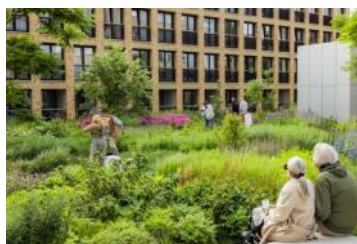
Opening De Meelfabriek Tuin met optreden van Theater Domino