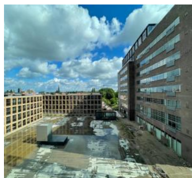
2022 Start aanleg tuin