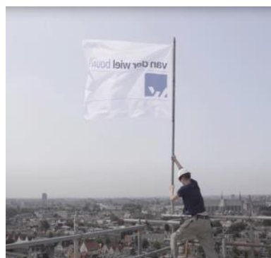
2021 hoogste punt Singeltoren