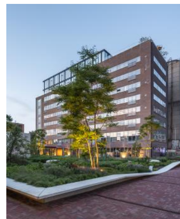
2024 De Meelfabriek Tuin - 240607 22h29 - SAA - MF P35 - R51 0939 - 3600