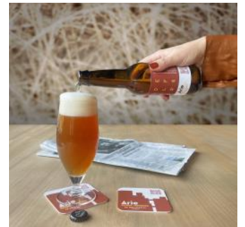
2024 lancering Arie Bier