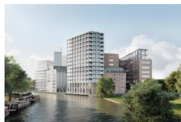
2024 Render De Meelfabriek vanaf Zijlsingel-Ankerpark (Studio Akkerhuis Architecture)