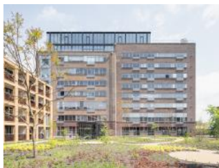
2023 Tuin + Molengebouw-Riffellokaal 230524 SAA - MF P32 - R5.1 0184 X - 5000