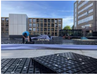
2023 De Meelfabriek Tuin - krattensysteem aanleg