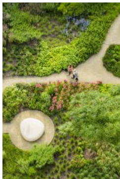
Opening De Meelfabriek Tuin