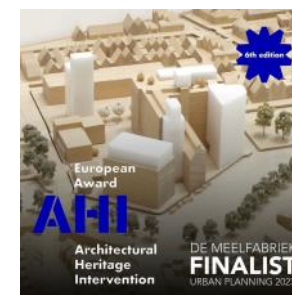
2023 De Meelfabriek AHI finalist