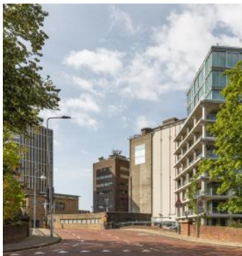
2025 De Meelfabriek complex va brug 250820 SAA - MF P37 - 0189 - 5K