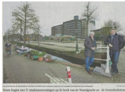
2017 Start bouw studentenwoningen