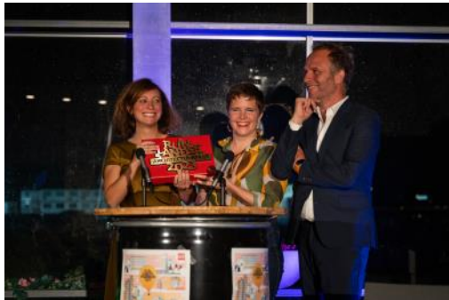
2023 RAP award, 111023-LR-67