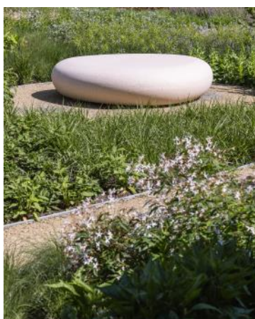
2024 De Meelfabriek Tuin zitobject Escofet - 240607 SAA - MF P35 - R52 0065 - 5000