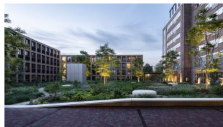
2024 De Meelfabriek Tuin - 240607 SAA - MF P35 - R51 0947 X - 5000