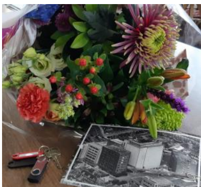
2020 Oplevering woningen Molengebouw en Riffellokaal