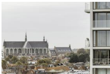
2022 De Meelfabriek Singeltoren en uitzicht over Leiden centrum - Corentin Haubruge