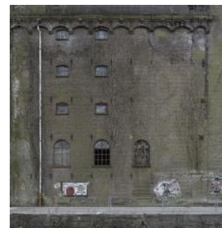
2025 Start werkzaamheden Ketelhuis 250306 SAA - MF P36 - 0393 - 5K