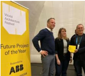
2019 WAF AWARD uitreiking