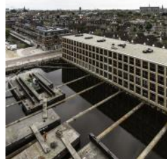
2019 Bouw ondergrondse parkeergarage _P6A7871 190514 - 1600x2400