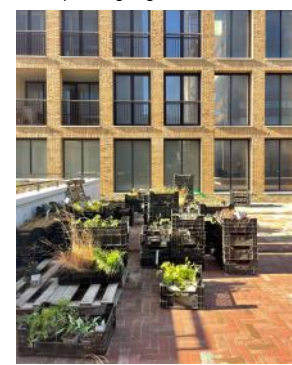
2022 Start beplanting tuin