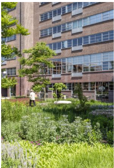
2024 De Meelfabriek Tuin - 240607 SAA - MF P35 - R51 0314 - 5000