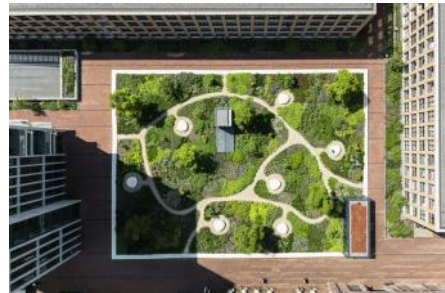
2024 De Meelfabriek Tuin - 240607 SAA - MF P35 - DRONE 0145 - 5000