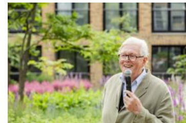
Opening De Meelfabriek Tuin - Piet Oudolf