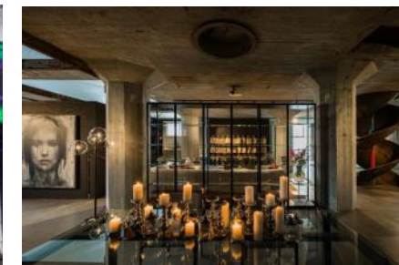
2019 Start verkoop tweede fase