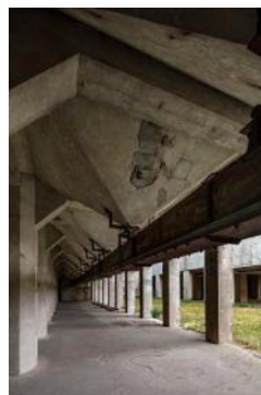
2018 Silogebouw 180817__P6A2239 2000x3000