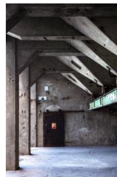
2018 Silogebouw 180928__P6A1025 2000x3000