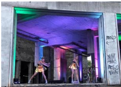
2019 Schemerstad bij De Meelfabriek