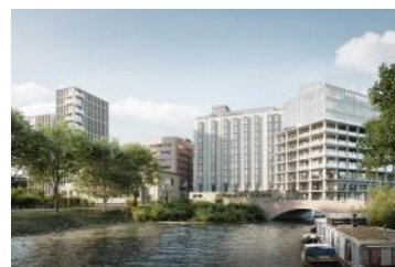
2024 Render De Meelfabriek vanaf Zijlsingel-Lakenpark (Studio Akkerhuis Architecture)