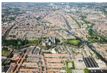
2015 De Meelfabriek luchtfoto