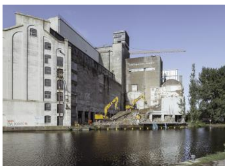
2022 De Meelfabriek - Zijlsingel 220907 SAA - MF P29 - R5.1 0006 - PRORVB - 4800