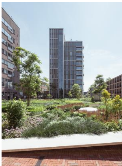
2024 De Meelfabriek Tuin - 240607 SAA - MF P35 - R51 0336 - 5000