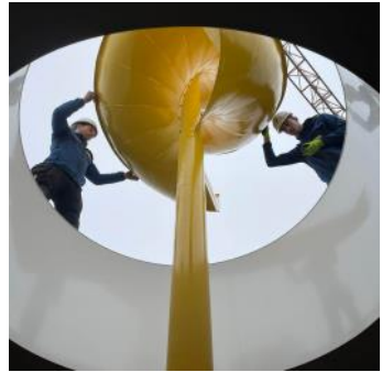
2024 wokkel inhijzen meelpakhuis