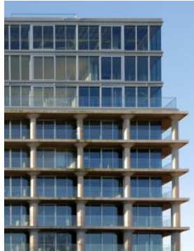
2024 Meelpakhuis