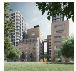
2024 Render De Meelfabriek vanaf Ankerpark