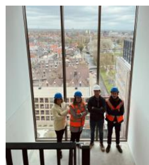
2022 Oplevering Singeltoren