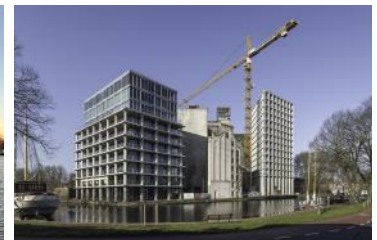
2025 De Meelfabriek aanzicht vanaf Zijlsingel - 250306 SAA - MF P36 - 0057 - 5K