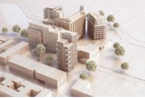
Maquette De Meelfabriek overzicht plan - Studio Akkerhuis Architecture