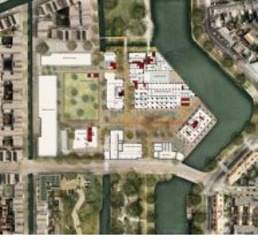
De Meelfabriek Masterplan Studio Akkerhuis Architecture