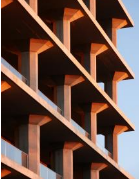
2024 Meelpakhuis - Ubbo van Dijk