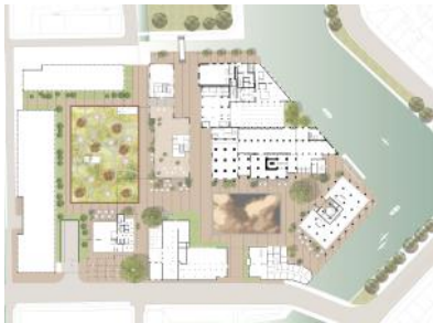
LOLA Landscape Architects 0 De Meelfabriek plan drawing