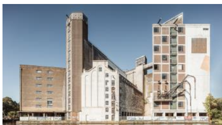
2020 De Meelfabriek - Zijlsingel _DS_006 PAN - X - 1600x2400