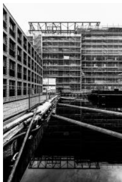
2019 Bouw ondergrondse parkeergarage _P6A7821 190514 - 1600x2400-2