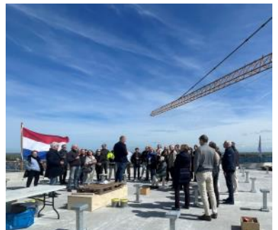
2024 hoogste punt Silotoren