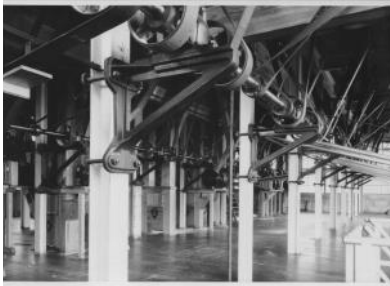
1890 (ca) - De Meelfabriek Leiden