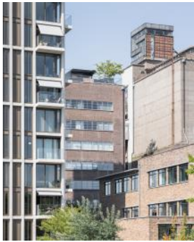
2023 De Meelfabriek mix van monumentaal en nieuwbouw 230531 SAA - MF P33 - 1059 - 5k