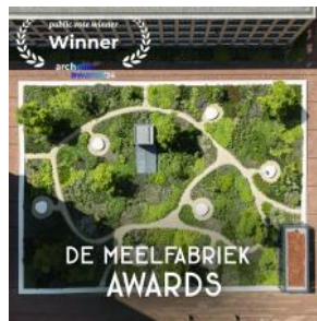
2024 Archello Parc of the Year