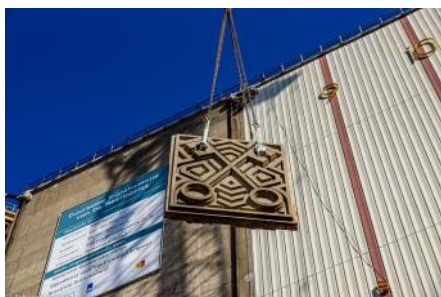
2021 sleutelpanelen omlaag takelen