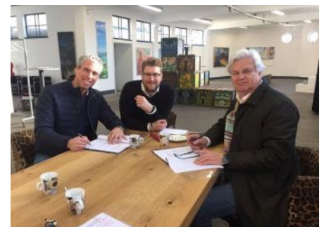
2017 Teken eerste huurcontract met V6K