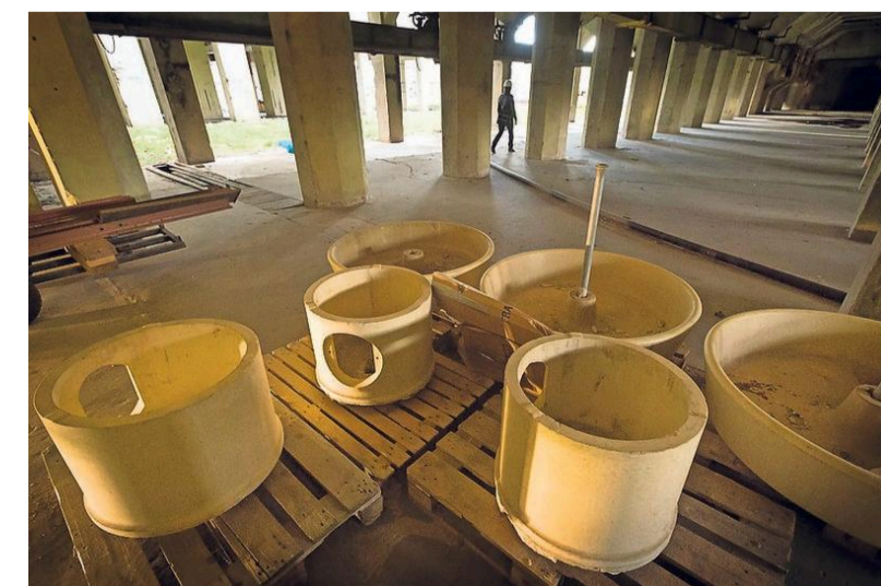
Deze grote wasbakken komen uit de kelder van het directiegebouw.

Leiden * De Meelfabriek is de meest bijzondere bouwput van Leiden. Achter de hekken is het net een mierenhoop: tientallen slopers en bouwers zijn hier aan het werk. Op de plek waar straks de binnentuin van de wereldberoemde architect Piet Oudolf komt, met daaronder een parkeergarage, laadt een kraan grote hoeveelheden puin in een zandwagen. Uit het monumentale Molengebouw en Riffellokaal is de vloer gesloopt. Ook het trapenhuis - een uitbouw - ging tegen de vlakte. Ineens is er vanaf het binnenterrein weer volop zicht op de Zijlpoort, een stuk verderop. Het directiegebouw, net naast de poort, komt langzaam uit de steigers. De schoongemaakte bakstenen hebben een gouden gloed. De monumentale stalen kozijnen zijn gerestaureerd en - heel vernuftig - voorzien van dubbel glas. Helemaal aan de rand van het bouwterrein, aan de kant van de Waardgracht, schieten twee appartementencomplexen voor studenten uit de grond. Dit bouwproject - fase 1 - hoort feitelijk niet bij de Meelfabriek, maar moest eerst worden uitgevoerd voordat er op het terrein begonnen kan worden met de bouw van een grote ondergrondse parkeergarage van elf meter diep. „Aan de kant van de studentenwoningen zitten aan twee zijden al damwanden in de grond”, zegt