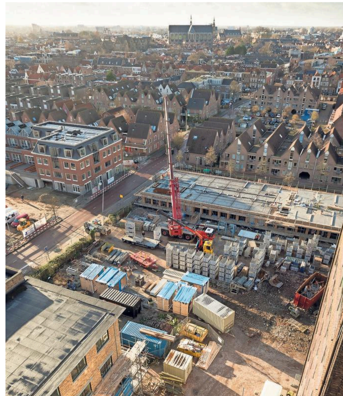
De toekomstige tuin van Oudolf en de plek van de Singeltoren staan vol met bouwmaterial.