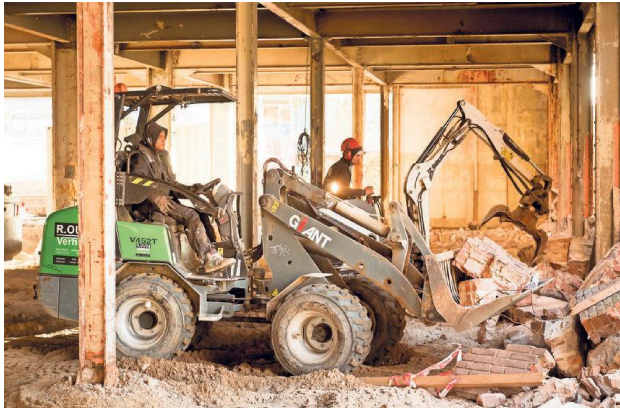
De vloer en stukken muur worden uit Molengebouw en Riffellokaal gesloopt.