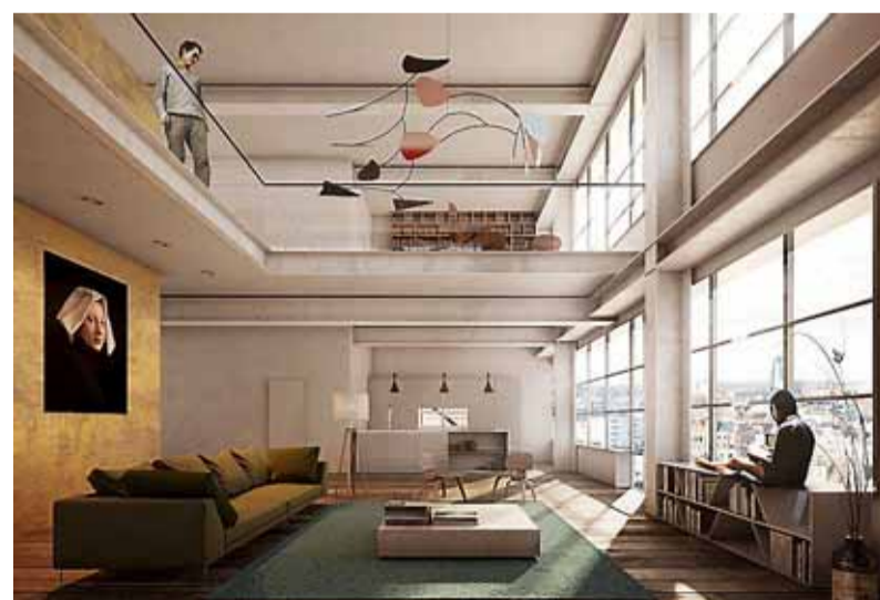
Impressie van een loftwoning.