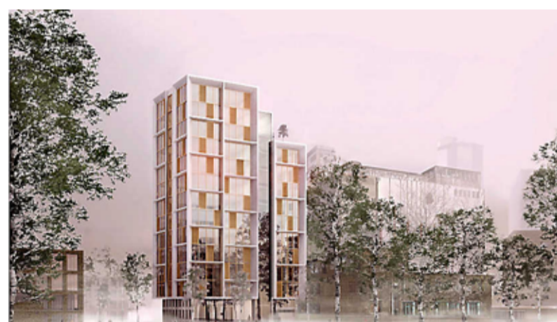
De nieuwe woontoren, naast het kantoorgebouw bij de poort. STUDIO AKKERHUIS