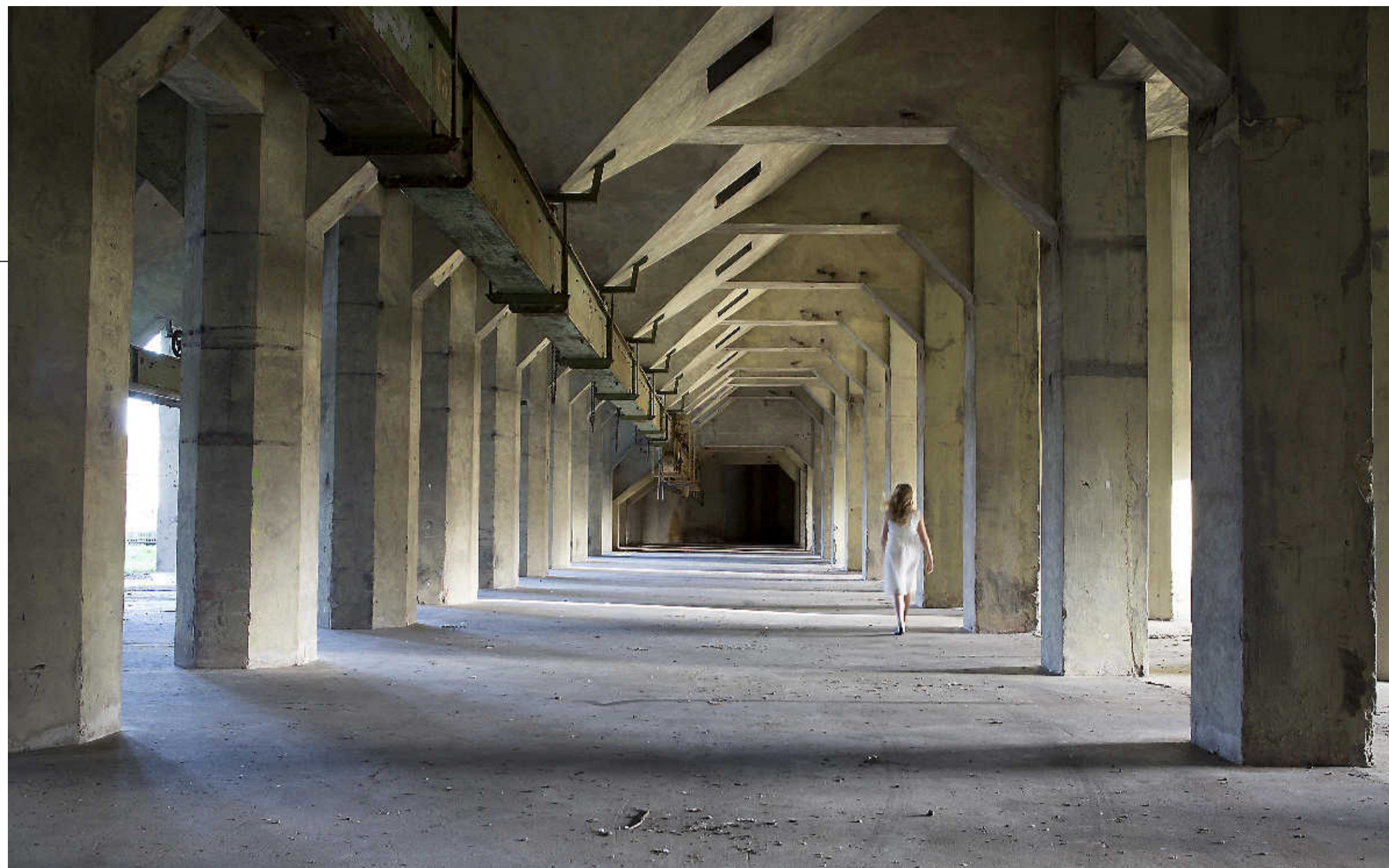
Tussen de pilaren komt het zwembad van Azzurro Wellness.